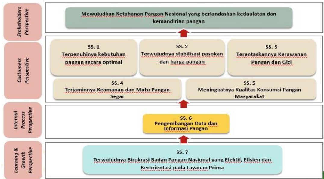
Gambar 2. Peta Strategi Badan Pangan Nasional Tahun 2022-2024

Badan Pangan Nasional telah menentukan sasaran strategis dengan menggunakan metode Balanced Scorecard (BSc) dan pendekatan empat perspektif yaitu stakeholders , customer , internal process dan learning and growth perspective .